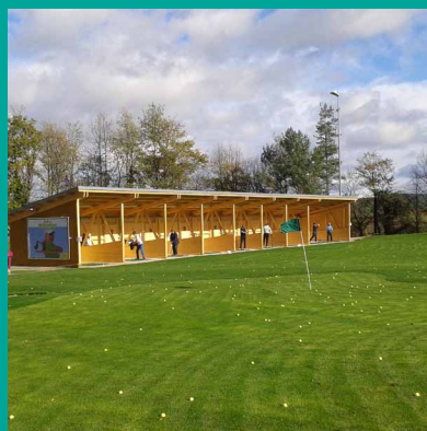
20 Abschlagplätze, davon 9 überdacht und beheizt