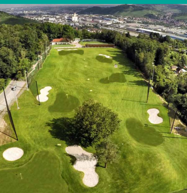
6 Zielgrünbereiche mit Greenbunker

Unsere Anlage ist öffentlich. Wer Geschmack gefunden hat, kann jederzeit wiederkommen.